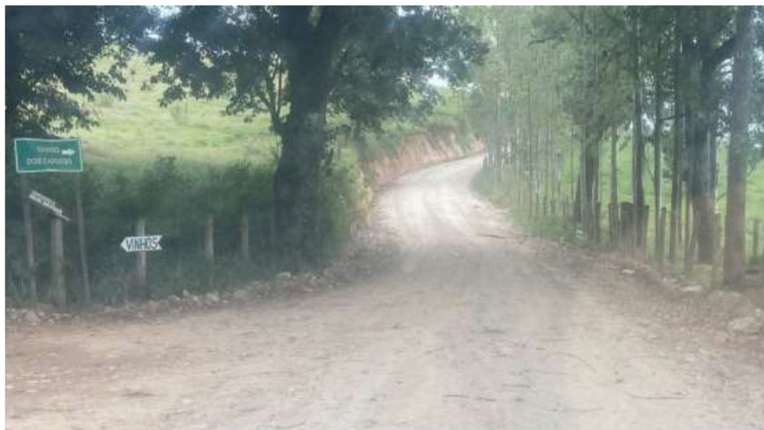
Imagem 07 Bairro Cardoso