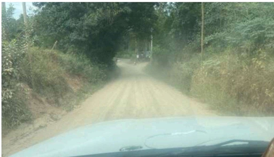
Imagem 9 Bairro Estrada Dito Dorta - Antigo Mosteiro