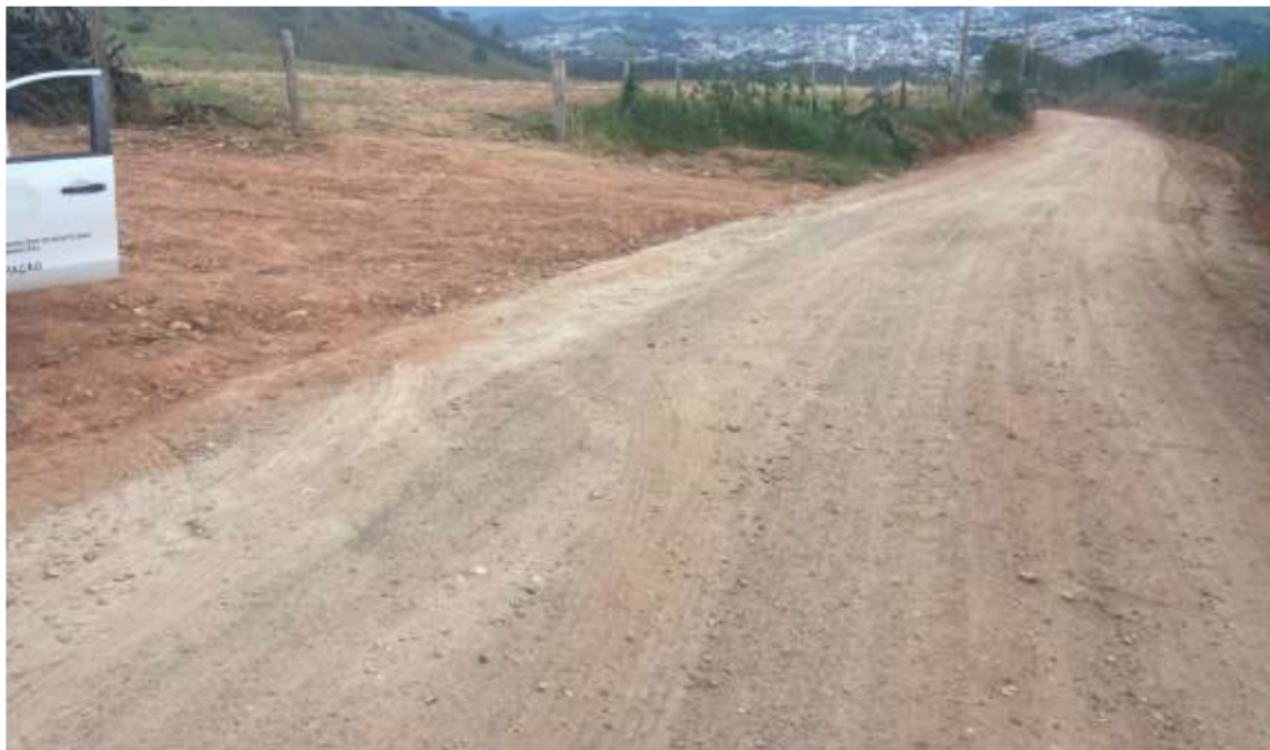
Imagem 10 Bairro Morro da Santa

Prefeitura Municipal de Monte Siao Rua Mauricio Zucato, 111 – Centro, Monte Siao/MG. CEP 37580-000 Telefone (35) 3465-4250 – e-mail: dpobras@montesiao.mg.gov.br