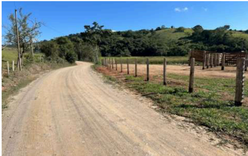
Imagem 05 Bairro Grotão

Segue abaixo o registro fotográfico das manutenções realizadas em bairros vizinhos no início de 2025, mediante a aquisição de cascalho, com o objetivo de manter as estradas em condições adequadas. Esta medida temporária foi adotada em virtude da pendência na regularização documental necessária para o arrendamento definitivo.