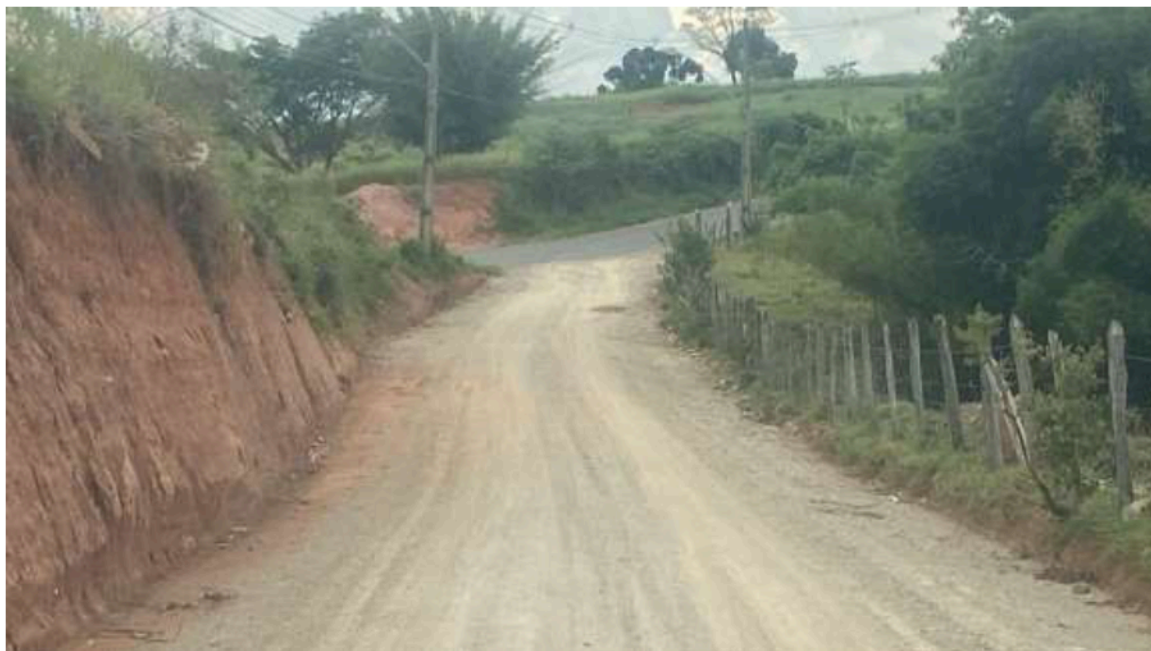
Imagem 11 Bairro Morro do chiquinho